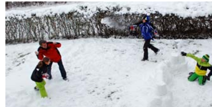
„Gott schirme deiner Dämme Bau...“

Teams durfte jeder mitdiskutieren und seine Vorschläge einbringen. Die Verbrüderung von Anarchos und Konservativen hat gezeigt, dass übliche Grenzen für uns absolut keine Rolle spielen, und wir haben die Herausforderung, einen Konsens zu finden, gemeistert und uns in letzter Sekunde auf einen Kompromiss geeinigt.