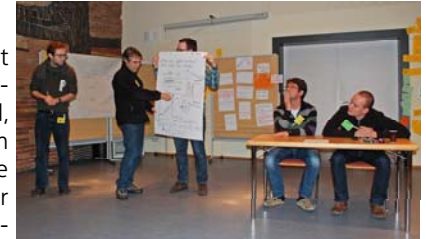
Weil wird nie, nie, nie untergehen!!!

Dass wir insgesamt eine sehr gut funktionierende Gruppe sind, durften wir beim Lösen der Aufgabe, unsere „Insel Weil“ vor einer herannahenden Flutwelle zu retten, beweisen. In drei starken