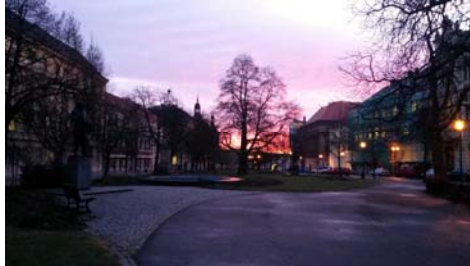
Ein Blick auf die wunderbare Atmosphäre der neuen Kulturhauptstadt Europas