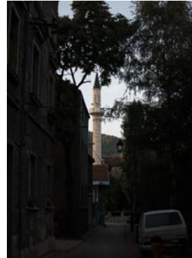
Was ist schon ein Minarett im Ortsbild verglichen mit einer kommunistischen Plattenbausiedlung?

Dann ging es vor kurzem darum, ob Tschechien Flüchtlinge