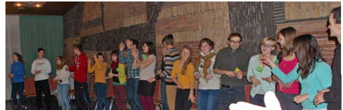
Ananas, Banana Kiwi!!!!!!!