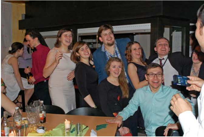
Frohes neues Jahr 2015!