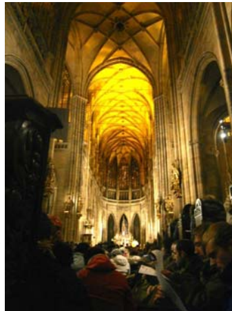
Unzählige junge Leute beim Taizé-Gebet im Prager Veitsdom

Es blieb auch genug Zeit, um die Stadt der goldenen Dächer