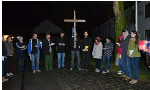
Statt der schwarz-rot-golden bemalten Kreuze bei Pegida gibt es bei der JA das übernationale Original!

Ein rein „christliches“ Abendland ist in meinen Augen also eine Fiktion. Es wird der Komplexität unserer eigenen Herkunft und der Vielfalt der Menschen, die heute in Europa leben, nicht gerecht. Europa ist immer auch demokratisch, aufklärerisch, humanistisch, tolerant, multireligiös, atheistisch. Und leider Gottes war Europa auch immer wieder – das muss man gegen die naiven Lobeshymnen auf das scheinbar paradisische Abendland in Erinnerung rufen – ein Ort der Barbarei, der Kriege, der Menschenverachtung.