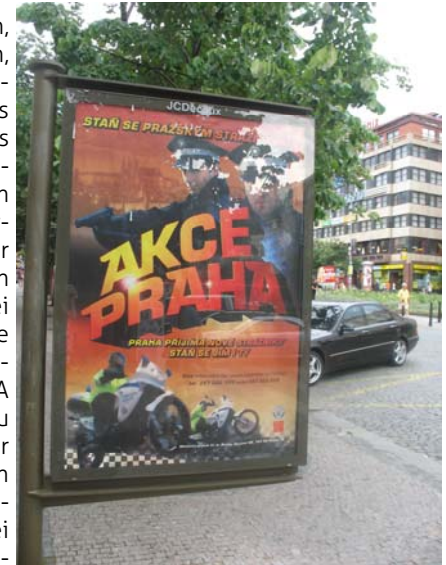
Ein Praha-Erlebnis auf dem Prager Wenzelsplatz

planen und leiten, einen KAK anbieten, das JA-Heft mitgestalten und vieles mehr. Darüber hinaus könnt ihr im Bundesvorstand der Jungen Aktion Verantwortung übernehmen. Ihr könnt eure Ideen einbringen und dabei gleichzeitig wertvolle Erfahrungen sammeln! Es ist unsere JA und die JA ist genau das, was wir aus ihr machen! Infos zu den Bundesvorstandswahlen und zu zwei weiteren verbandsinternen Angelegenheiten findet ihr auf der letzten Seite.