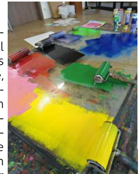
Europäischer Freiwilligendienst—eine bunte Sache