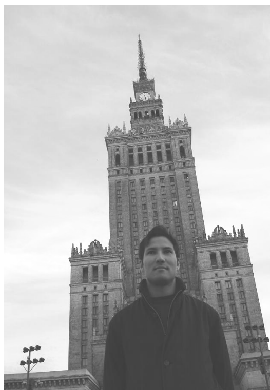
Warschau: Im Hintergrund der Palast der Kultur und der Wissenschaft