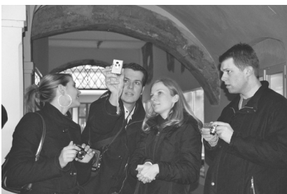
Der Profi erklärt... - mit professioneller Unterstützung werden auch einfache JAler zu echten Profis