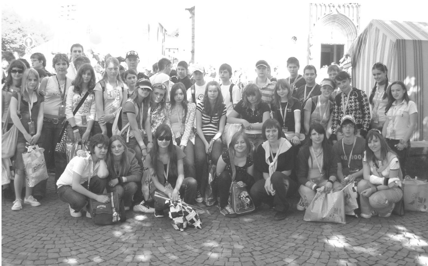
Die slowakischen Schüler erkundeten in einem Spiel die Stadt Osnabrück und lernten viel über die Geschichte. Nach der Auswertung waren die Siegergruppen sehr erfreut über die Preise.

Auf dem Katholikentag gab es viel zu erleben