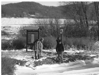
Mitten in der Natur. So erlebten die JAler den Böhmerwald!

kochen, Holz hacken und mit dem traditionellen Holzofen das Haus heizen würden. Vielleicht klingt das kompliziert, aber gerade dadurch hatten wir sehr viel Spaß und konnten uns besser kennenlernen. Für das Kochen mussten wir natürlich einkaufen. Diese Möglichkeit gab es in Volary (Wallern), ca. 10 km von Pěkna, wo wir auch in einer schönen Kirche die Sonntagsmesse besuchten. Der Lauf der WWW ist hauptsächlich so geblieben, wie wir ihn kennen. Es gab wie immer Kennenlernspiele, frühes Aufstehen und Frühstück, Referate zum Thema „Terrorismus“ und natürlich Meditationen. Allerdings war das Programm ein bisschen lockerer als normalerweise und das gab uns die Möglichkeit genug Freizeit zu haben, um das wunderschöne tschechische Land zu genießen. Nicht weit von unserem Haus gab es schöne kleine Dörfer, der sehr große und zugefrorene Lipno-Stausee, auf dem man Schlittschuhlaufen und natürlich den Schnee genießen konnte. Zu unser aller Verwunderung fuhren die Tschechen mit ihren Autos über den See und nahmen diesen so als Abkürzung.