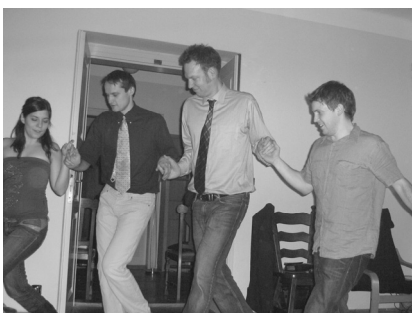
So tanzt man bei der WWW

WinterWerkWoche! Wenn wir dieses Wort hören, dann kommen uns Erinnerungen von den vergangenen Jahren in den Kopf, an die wir mit Sehnsucht zurückdenken. Aber es kommen auch Hoffnungen auf, dass die nächste WWW wieder genau so schön wird. Die WWW 2007/08 aber war ein ganz neues Erlebnis und niemand wusste, was man erwarten sollte.