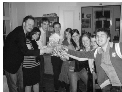
Auf ein gutes Neues Jahr!

Mein Zitat: „Ob in Windischeschenbach oder in Tschechien, die WWW lohnt sich! Und für alle, die nicht