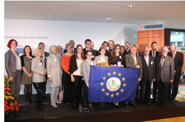
Preisübergabe im Europäischen Parlament