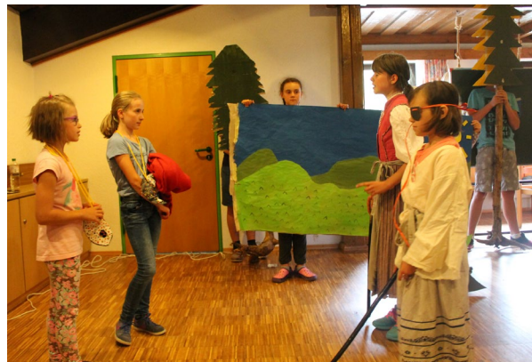
Theaterstück zur deutsch-tschechischen Geschichte