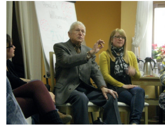
Herr Kavalír und ich bei einem Zeitzeugengespräch