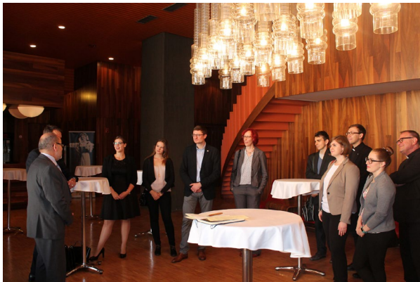
Zu Besuch in der Tschechischen Botschaft