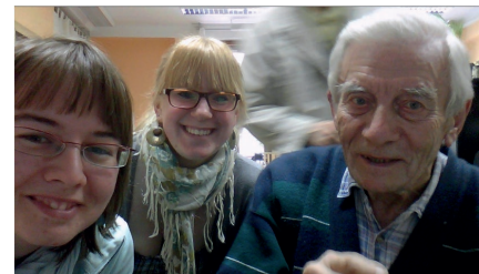
Testen der Webcam im Computerkurs