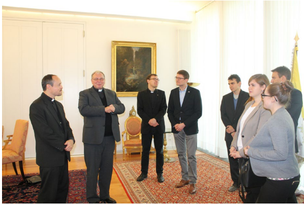
Interessante Gesprächsrunde in der Nuntiatur