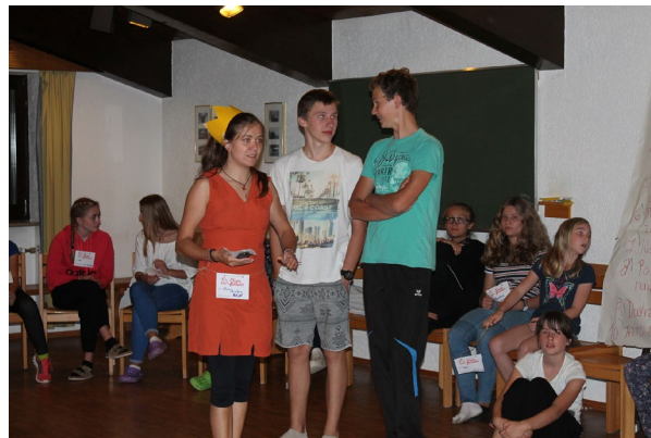
Letzte Vorbereitungen vor dem Auftritt