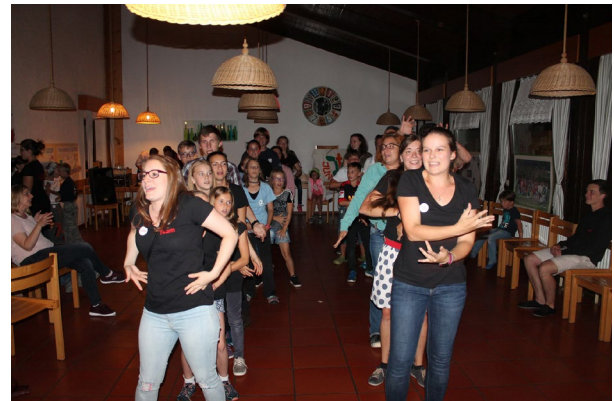
Partystimmung bei der Feier