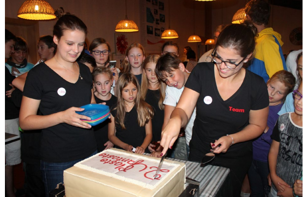
Anschnitt der Torte