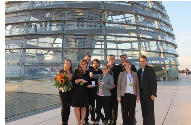
Gruppenfoto auf dem Bundestag